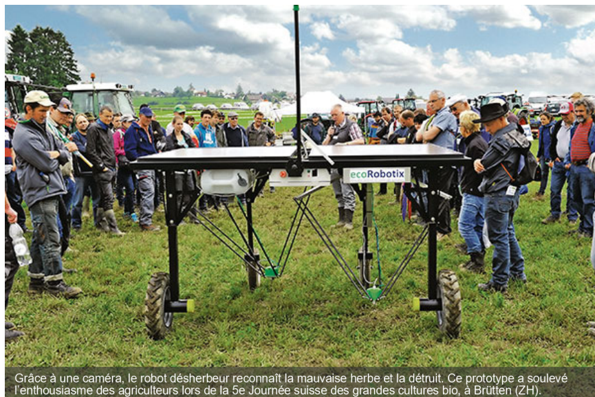
Grâce à une caméra, le robot désherbeur reconnaît la mauvaise herbe et la détruit. Ce prototype a soulevé l'enthousiasme des agriculteurs lors de la 5e Journée suisse des grandes cultures bio, à Brütten (ZH).